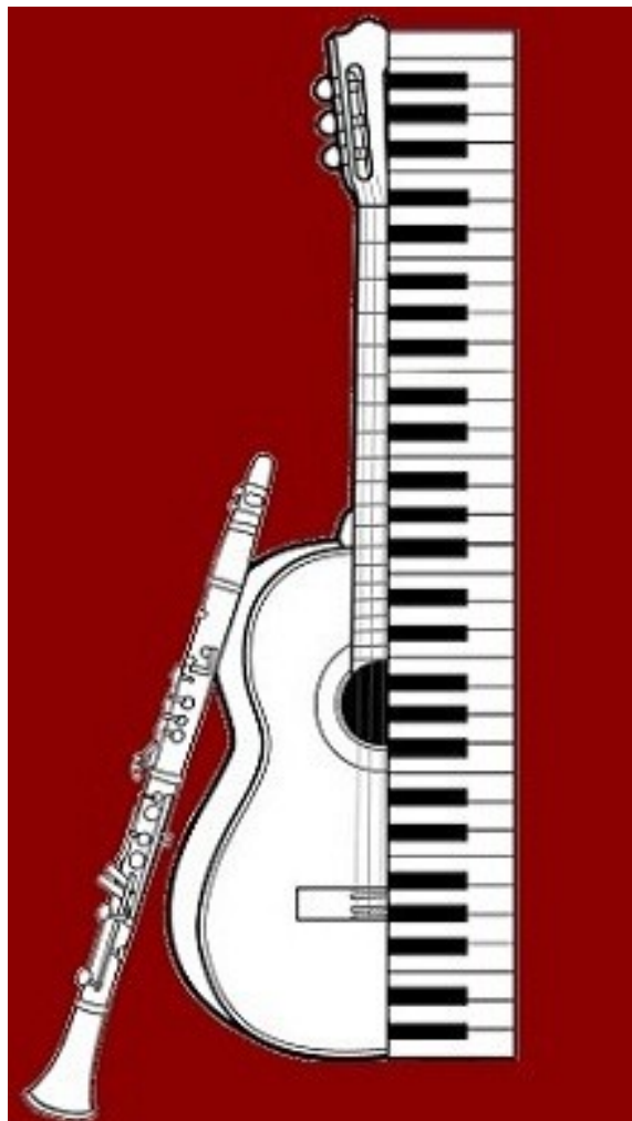
LOGO der neuen MUKERBUDE im Jahr 2018

Heute 1. Mai 2018 die komplette NeuEntwicklung der MukerBude ist abgeschlossen, steht im Netz und hat als VorzeigeObjekt dieses Logo.